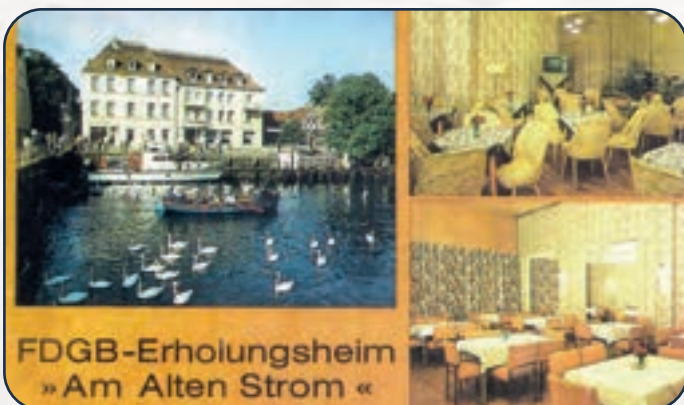
FDGB-Erholungsheim »Am Alten Strom«